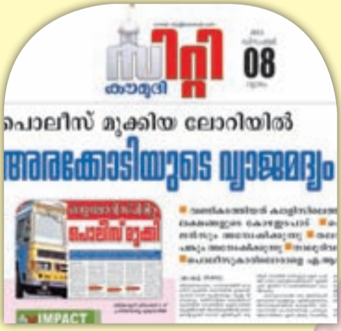
ഡിസംബർ എട്ടിന്റെ മുഖ്യവാർത്ത

എസ്.ഐ-ഡ്രൈവർ ഭായിഭായി പിറ്റേപ്പാലയിൽ രാത്രി പട്ടോളിംഗിനുണ്ടായിരുന്ന അഡി.എസ്.ഐയെ പൂലർച്ചെ ഡ്യൂട്ടി കഴിഞ്ഞ് പിരിഞ്ഞ ശേഷം ഡ്രൈവർ 12 തവണയാണ് ഫോണിൽ വിളിച്ചത്. അതും സൗജന്യമായി പരസ്പരം വിളിക്കാവുന്ന ഔദ്യോഗിക നമ്പർ ഒഴിവാക്കി. അഡി.എസ്.ഐയുടെ ഡ്യൂട്ടിയിൽ ഫോണിലെ കള്ളനമ്പരിലേക്കാണ് വിളി വന്നത്. പത്തുമിനിറ്റിലേറെ ദൈർഘ്യമുള്ള കോളുകളായിരുന്നു ഓരോന്നും. സ്പെഷലിലെ ചില കാര്യങ്ങൾ പറയാനാണ് അഡി.എസ്.ഐയെ വിളിച്ചതെന്നാണ് ഡ്രൈവറുടെ മൊഴി. എട്ടു മണിക്കൂറോളം ഒതുച്ച് ഡ്യൂട്ടിയെടുത്തിട്ടും പറയാൻ മരന്ന എന്തു സ്പെഷൽ കാര്യമാണെന്ന അന്വേഷകരുടെ ചോദ്യത്തിന് മുന്നിൽ പൊലീസുകാർ കൂഴങ്ങി. ഞായറാഴ്ച പൂലർച്ചെ നാലു മണിക്ക് അഡി.എസ്.ഐയുടെ ഫോണിലേക്ക് പ്രദേശത്തെ മണൽമാഫിയ തലവന്റെ കോളും വന്നിരുന്നു. ഇതേത്തുടർന്നാണ് ലോറി വിട്ടുനൽകി ഉള്ളതുട് പോക്കറ്റിലിടാൻ ധാരണയായത്.