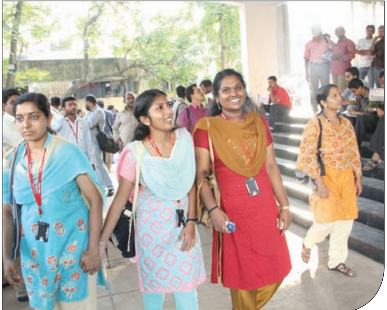
കൈരളി തിയേറ്ററിൽ നിന്നും ചിത്രം കണ്ടിറങ്ങുന്ന വിദ്യാർത്ഥിനികൾ