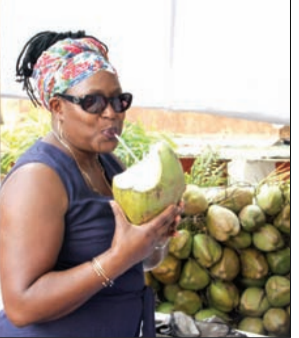
യു.കെ.കോരി ജൂൺ ഗുവാനി ഇളമിർ ആസ്വദിക്കുന്നു