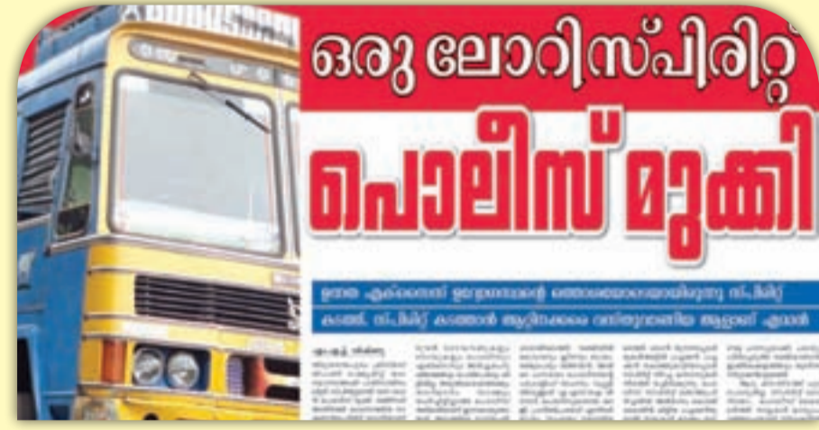
ഡിസംബർ ആറിന് സിറ്റികാമുകി പ്രസിദ്ധീകരിച്ച മുഖ്യവാർത്ത

കാട്ടാക്കടയ്ക്ക് പോകേണ്ട ലോറിക്ക് വഴിതെറ്റിയെന്നും 'നേർവഴി' കാട്ടാൻ തങ്ങൾ പിറകെ പോയെന്നുമാണ് പൊലീസുകാർ പറഞ്ഞത്. ഒരു വലിയ കയറ്റം കയറിപ്പോയ ലോറി അപ്രത്യക്ഷമായത്രേ.