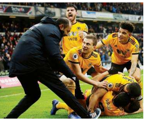
ഇംഗ്ലീഷ് പ്രീമിയർ ലീഗിൽ ലെസ്റ്ററിനെതിരെ അവസാന നിമിഷം വ്യതിചലിപ്പിച്ച് വിജയം നേടിയ ഹാർട്ട്സ് ടീം

കാൻപൂർ: ആറ് തവണ ആസ്പേലിയൻ ഓപ്പൺ കോണറിലും അനൂജയും ഫെഡറൽക്കോഴും