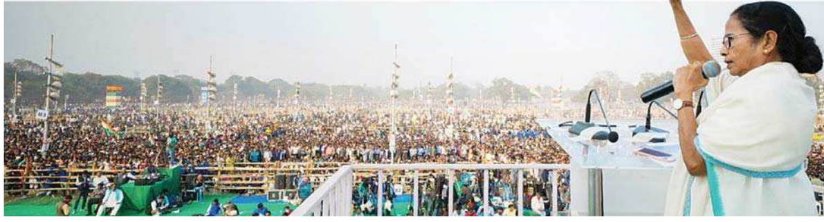
കൊൽക്കത്തയിൽ നടന്ന പ്രതിപക്ഷ മഹാറാലിയെ പശ്ചിമബംഗാൾ മുഖ്യമന്ത്രി മമതാ ബാനർജി അഭിസംബോധന ചെയ്യുന്നു

സ്ത്രീകളെ ശബരിമലയിൽ കയറ്റുന്ന മിനിമം പരിപാടിയിലേക്ക് നവോത്ഥാനം - വി.എസ് മതിലപ്പണി കൂടി ഉൾപ്പെടുത്തും