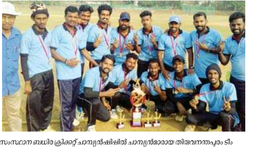
സംസ്ഥാന ബഡ്ജറ്റ് ക്രിക്കറ്റ് ചാമ്പ്യൻഷിപ്പിൽ ചാമ്പ്യൻമാരായ തിരുവനന്തപുരം ടീം

തിരുവനന്തപുരം: സംസ്ഥാന ബഡ്ജറ്റ് ക്രിക്കറ്റ് ചാമ്പ്യൻഷിപ്പിൽ തിരുവനന്തപുരം ടീം ജേതാക്കൾ.