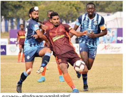
ഗോകലം - മിനർവ മത്സരത്തിൽ നിന്ന്

ഇന്ത്യൻ ടീമിന് ബാലിക്കോ മലയാളി ആസ്പേലിയൻ മണ്ണിൽ വിജയം നേടാനാകില്ല.