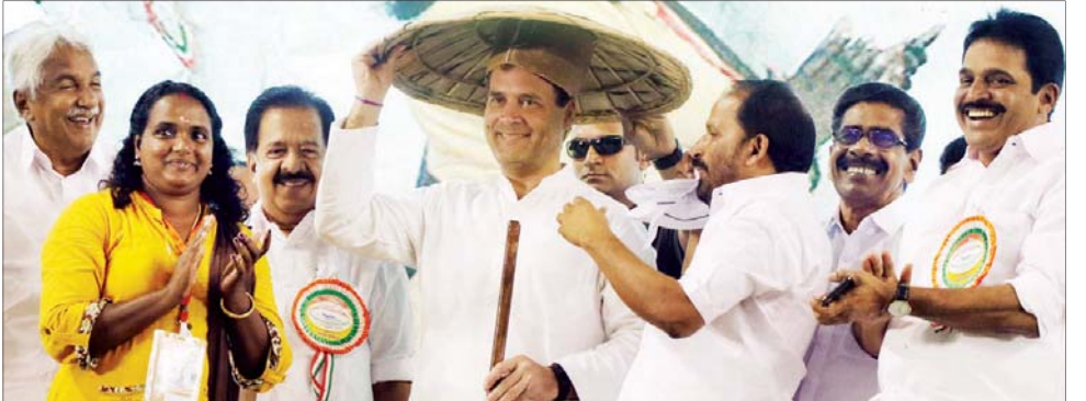
തൊപ്പി റെഡി, ഇനി തുറന്നുതാൽ മതി... തൃശ്ശൂർ തൃപ്രയാറിൽ ദേശീയ പരിഷ്കരണ പാർലമെന്റർ ഉദ്ദേശ്യ പടങ്ങിനിടെ രാഹുൽ ഗാന്ധി...